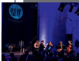
KLASSIK IM FRÜHLING

Alle Erlöse des Abends kommen dem Betrieb Dingolfing der Landshuter Werkstätten GmbH / Tochtergesellschaft der Lebenshilfe Landshut e. V. zugute, einem Verein, der sich für die Belange von Menschen mit Behinderung in allen Altersstufen einsetzt.